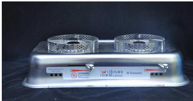
ምስል 1: ባለሁለት ማብሰያ ምድጃ

ምድጃዎቹ የተለያዩ የቆይታ ጊዜዎች ያሏቸው ናቸው። የአሉሚኒየም ሞዴሉ የ6 ዓመት የአገልግሎት ቆይታ ጊዜ ያላቸው ሲሆን፣ የአረብ ብረት (ስቴይንለስ ስቴል) ሞዴሎቹ የ10 ዓመት ናቸው። የምድጃዎቹ የማቆሪያ አቅም 1.2 ሊትር ሲሆን በከፍተኛው አቅም ከ4-5 ሰዓታት የመንደድ አቅም እና በዝቅተኛ ሙቀት ከ9-10 ሰዓታት ድረስ መሞቅ ይችላል።