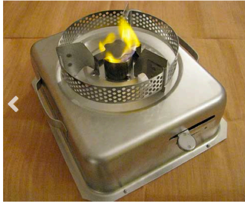
Figure 2: Réchaud de cuisson à seul brûleur