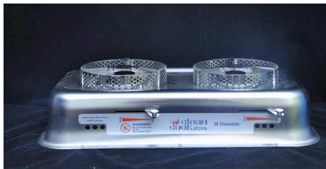
Figure 1: Réchaud de cuisson à double brûleur

Les réchauds ont une durée de vie variable : le modèle en aluminium devrait durer 6 ans; celui en inox 10 ans. La capacité de la cartouche des réchauds est de 1,2 litre avec une durée de combustion de 4-5 heures à chaleur maximum et de 9-10 heures à feu doux